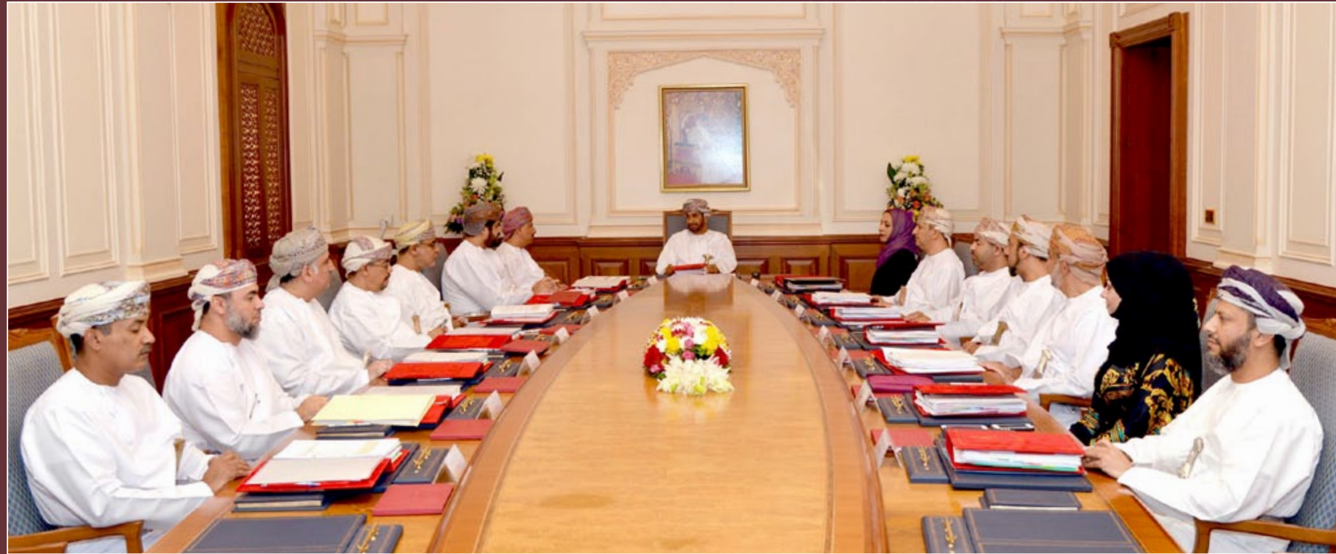
إجتماع مجلس التعليم