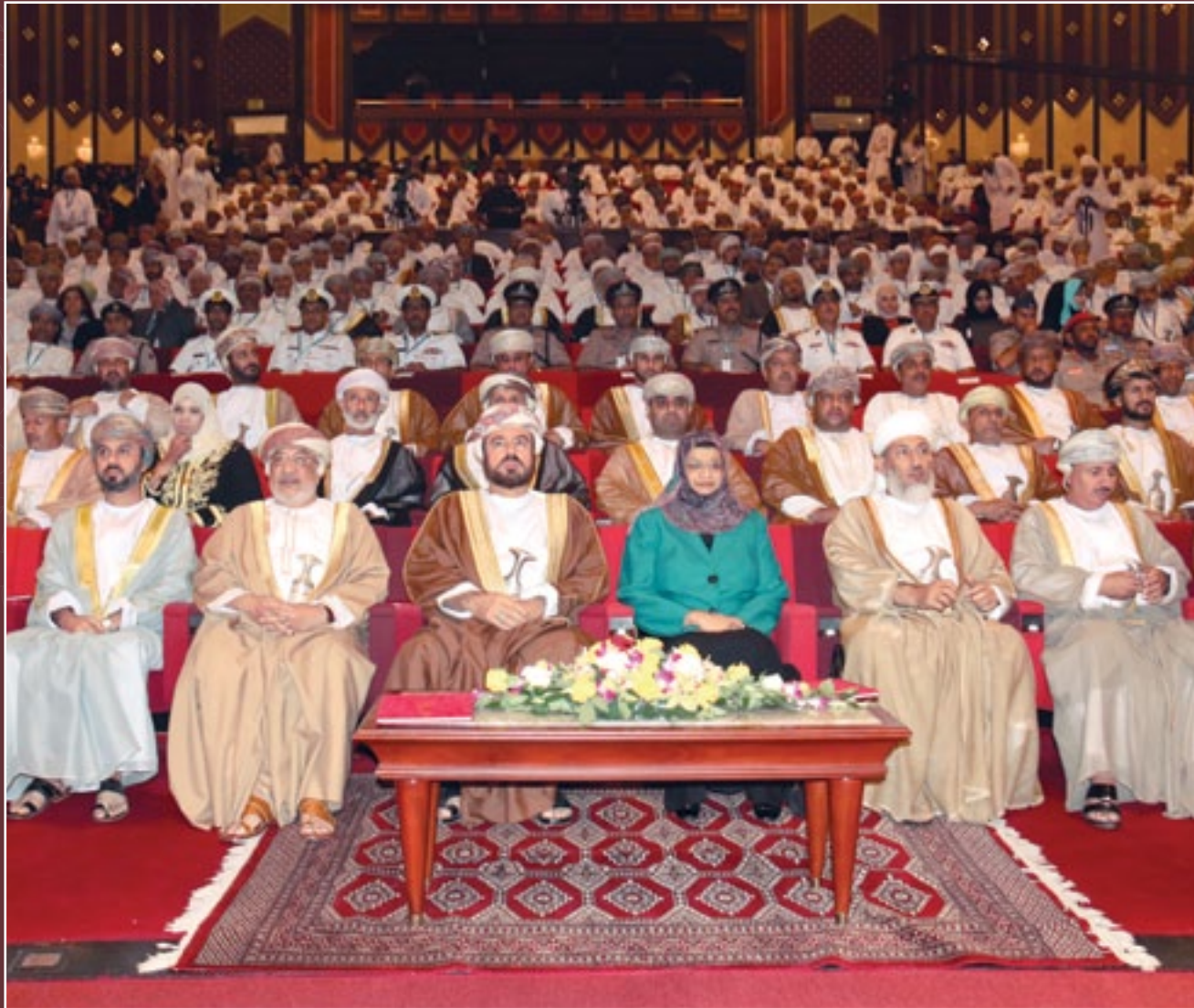
ندوة التعليم في سلطنة عمان : الطريق إلى المستقبل